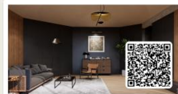
星野上 Starwild Glamping 栖庭双峰 Libra-D